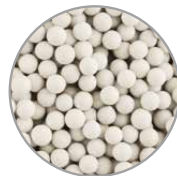
Anioni Ceramiche antiossidanti