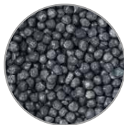
Granulato di carbone attivo