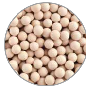
Anioni Ceramiche antibatteriche